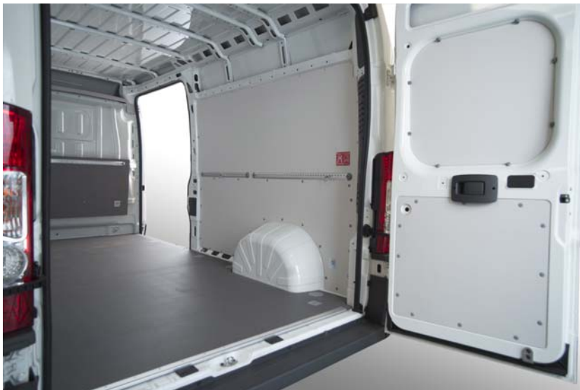
Abbildung 2 VANYCARE®-Komplettausstattung (Boden, Wand, Rammschutz incl. Zurrschienen)