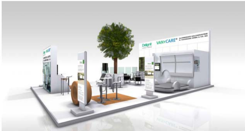
Abbildung 1 Messestand IAA 2010 Halle 13 Stand C 58