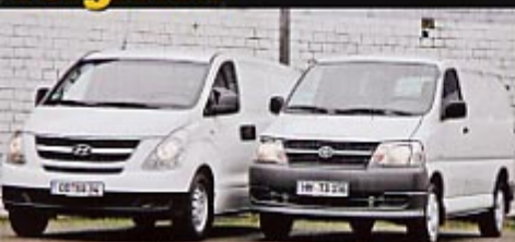
Toyota Hiace 2.5 D-4D vs. Hyundai H-1 2.5 CRDi