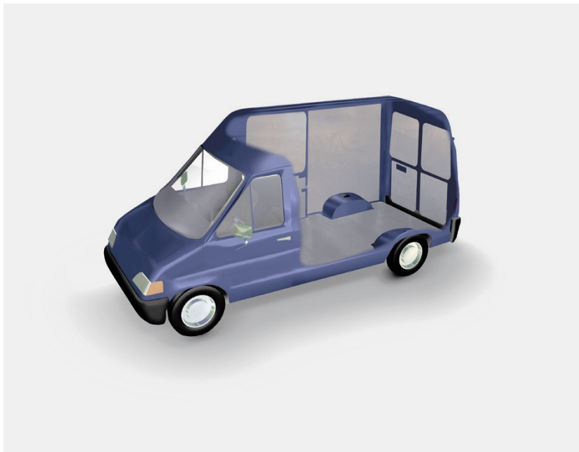
Abbildung 3 VANyCARE ® -Schemadarstellung