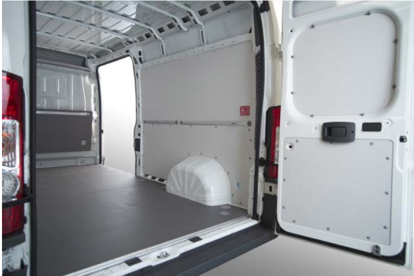
Abbildung 2 Fiat Ducato mit VANyCARE ® -Komplettausstattung (Boden, Wand, Rammschutz incl. Zurrleisten)