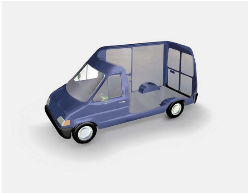
Abbildung 3 VANyCARE ® -Schemadarstellung