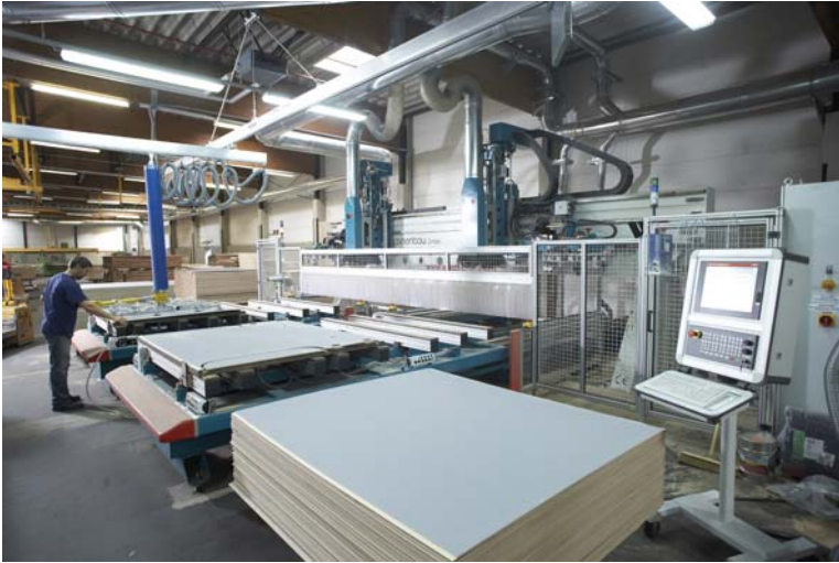
Abbildung 4 Produktion von VANYCARE ® -Laderaumschutzausstattung auf modernen CNC-Bearbeitungszentren